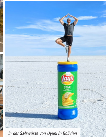
In der Salzwüste von Uyuni in Bolivien