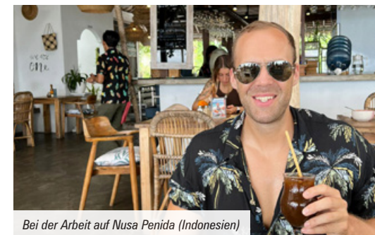
Bei der Arbeit auf Nusa Penida (Indonesien)