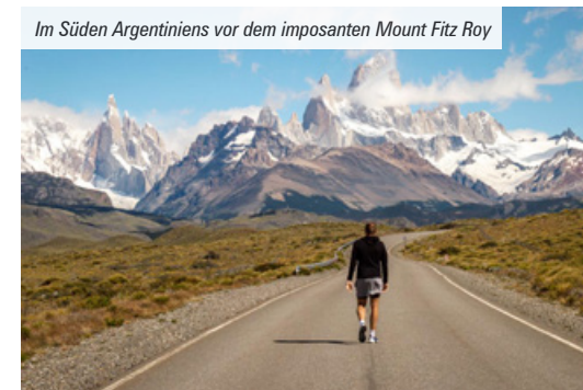
Im Süden Argentiniens vor dem imposanten Mount Fitz Roy