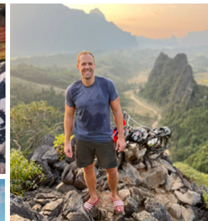
Mit meinen roten Wander-Adiletten auf einem Aussichtspunkt bei Vang Vieng (Laos)