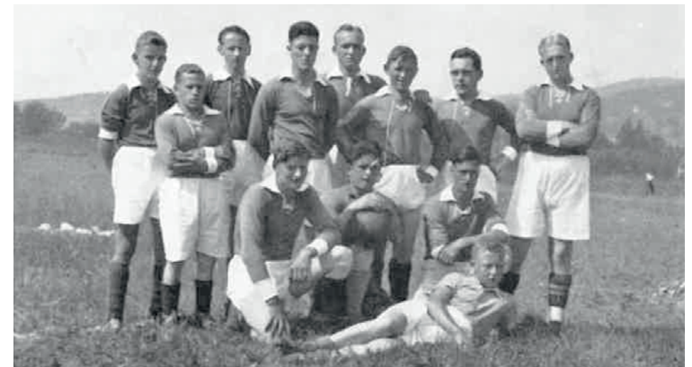
Aller erste Mannschaft des FC Gontenschwil

Titelseite Bulletin 1961 - 25 Jahr Jubiläum