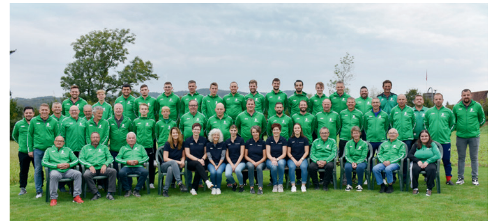
Funktionäre FC Gontenschwil 2021/2022

Das Club-Bulletin-Team wünscht viel Spass beim Lesen und sagt in diesem Sinne: HOPP FCG!