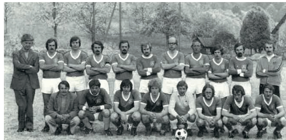
Aufstiegs Mannschaft 1974/75 von 4. Liga in die 3. Liga

Titelseite Bulletin 1986 - 50 Jahr Jubiläum