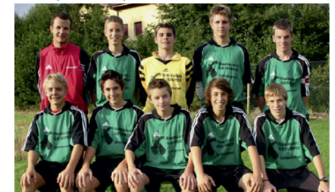
Spieler (dritter von rechts)